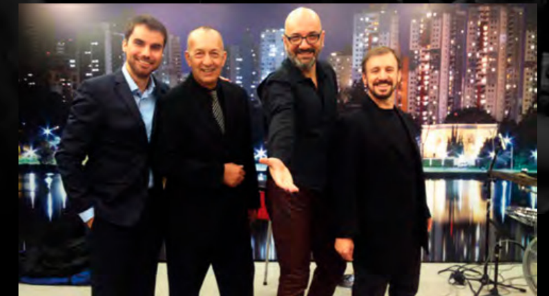
Quarteto Collman Pastori nos estúdios da RPC (Curitiba), 2014.